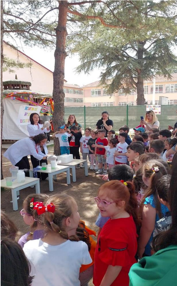
Eğitim Fakültesi Okul Öncesi Bilim Şenliği