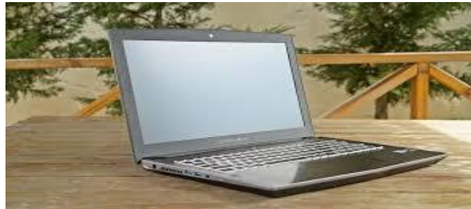
Resim 14- Bilgisayar Malzemeleri Görünüm