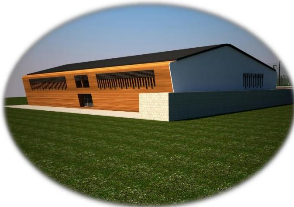
Resim 16- Spor Kompleksi Görünüm

2018 Yılı Yatırım Programı ile 5.000.000,00.-TL ödenek tahsis edilmiş, 892.000,00.-TL likit ödenek, Gelir Fazlası Ödenek ve İdari ve Mali İşler Daire Başkanlığı tarafından kullanılmayan ödenek aktarılmıştır. 2018 yılsonu itibari ile toplam ödenek miktarı 5.892.000,00.-TL'ye ulaşan ödeneğin 5.891.427,75.-TL'si kullanılmıştır.