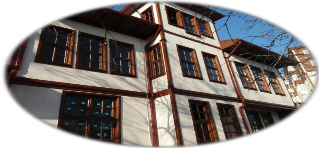
Resim 15- YÜCEBİYIKLAR Konağı Görünüm

2018 Yılı Yatırım Programı ile 100.000.-TL ödenek tahsis edilmiş olup, 2018 yılı içinde muhtelif işler projesinden 679.000,00.-TL ödenek aktarılmıştır. 779.000,00.-TL'ye ulaşan ödeneğin 2018 yılsonu itibariyle 778.075,31.-TL'lik kısmı harcanmıştır.