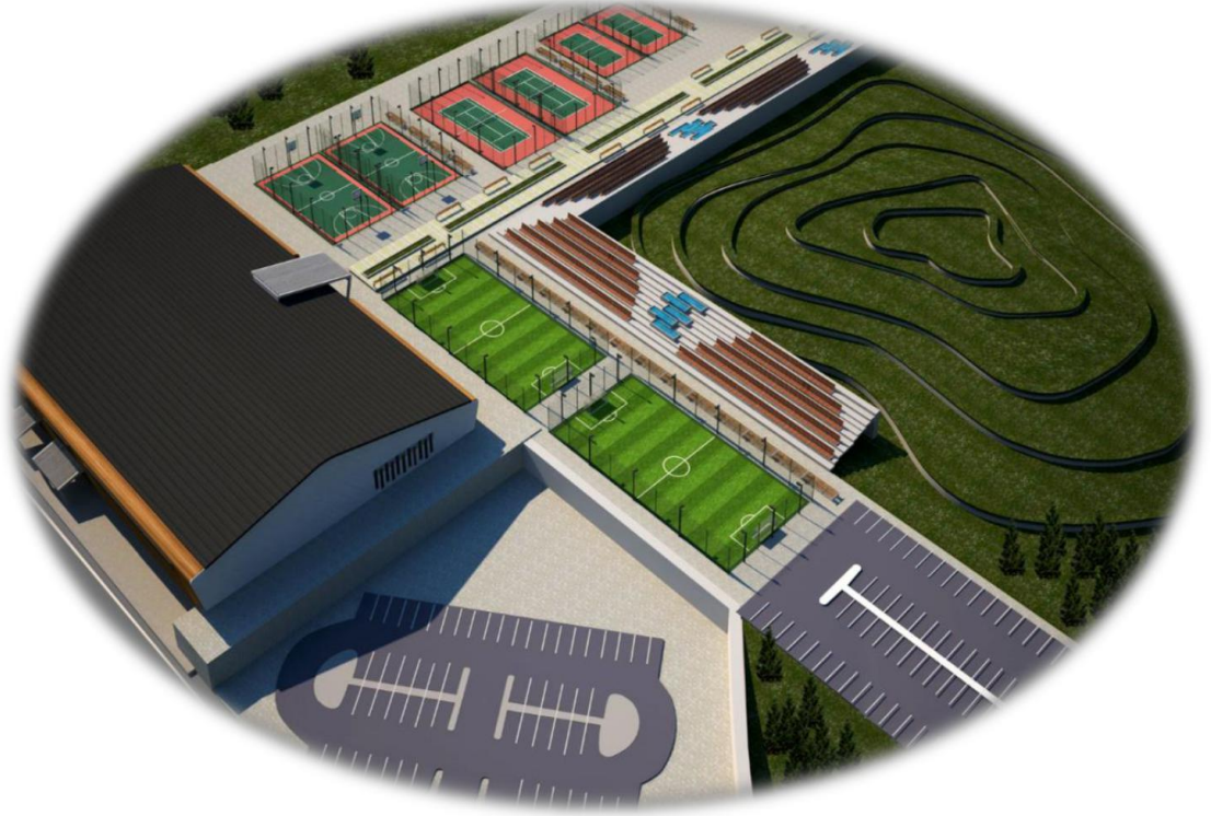
Resim 18-Spor Kompleksi