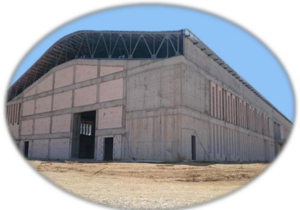
Resim 17- Spor Kompleksi Görünüm