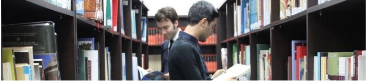
Resim 6- Bilgehan Bilgili Merkez Kütüphane

Kütüphaneler, günümüz dünyasında bilgiye erişim ve bilgi paylaşımı açısından büyük önem taşımakta, bu önem özellikle üniversitelerde bir kat daha artmaktadır. Akademik anlamda bir kütüphane, bulunduğu üniversiteye önemli derecede katkı sağlarken nitelikli ve zengin kaynağa sahip kütüphanesi olan üniversiteler daha hızlı gelişmektedir.