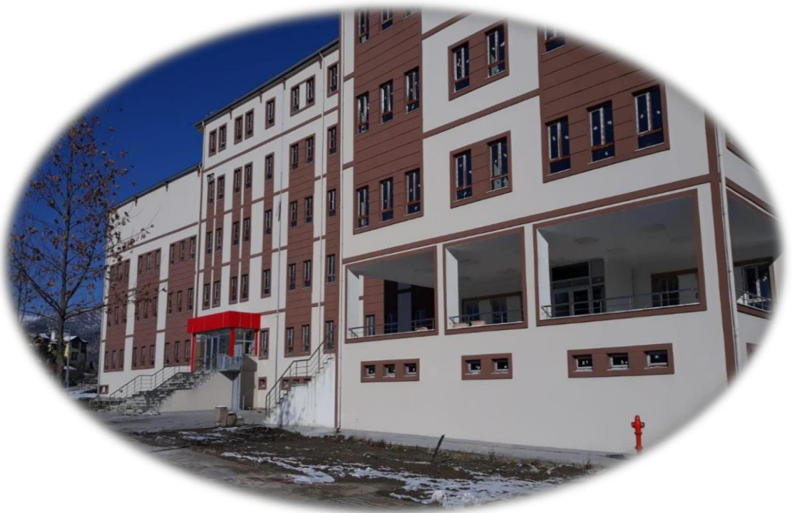
Resim 13- Tosya Meslek Yüksekokulu İnşaat Görünümü