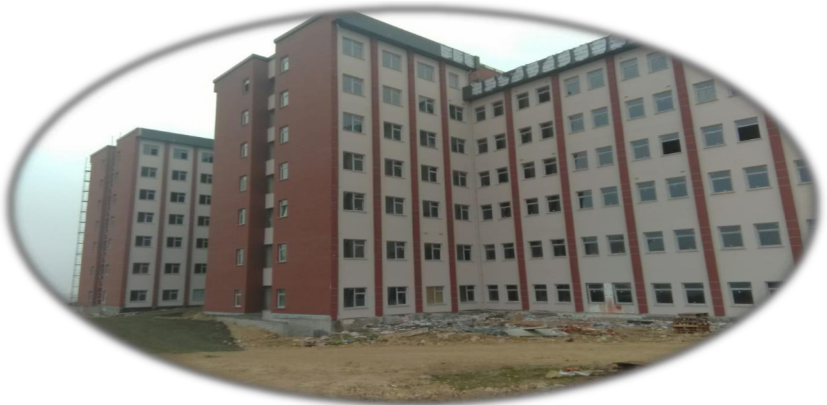
Resim 9- Kastamonu Tıp Fakültesi Morfoloji Binası Görünüm