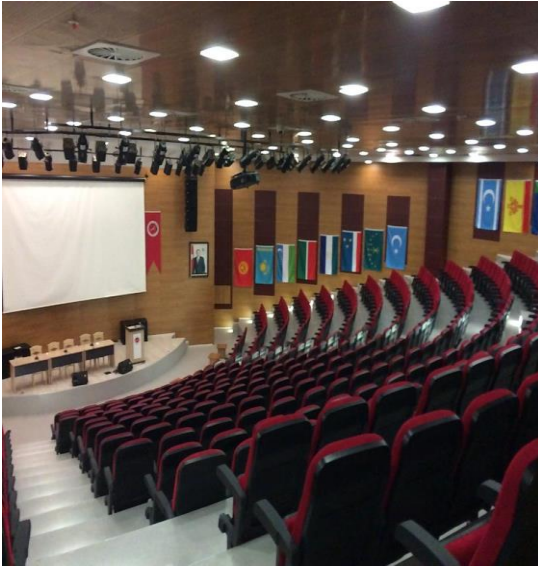
Resim 4- Bilgehan BİLGİLİ Konferans Salonu