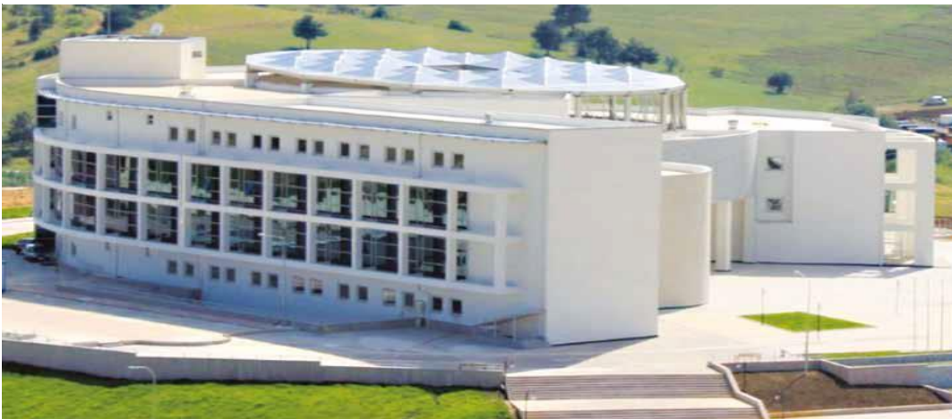
Resim 2- Kastamonu Üniversitesi Rektörlüğü Görünüm