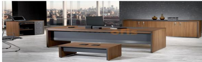
Resim 14 - Büro Mobilyaları