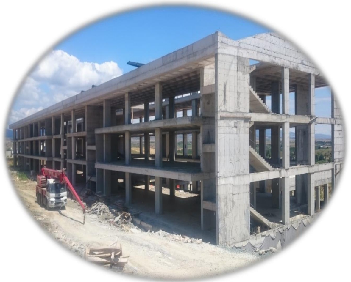
Resim 11- İktisadi ve İdari Bilimler Fakültesi İnşaat Alanı Görüntüsü