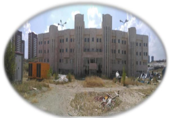
Resim 20- Hastane Binası Görünüm