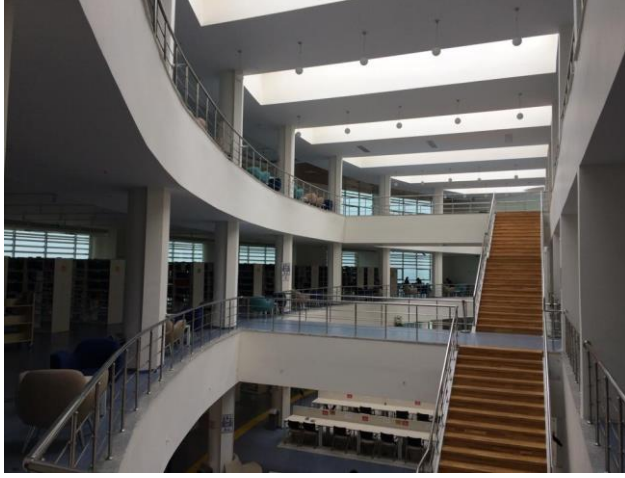
Resim 7- Bilgehan Bilgili Merkez Kütüphane