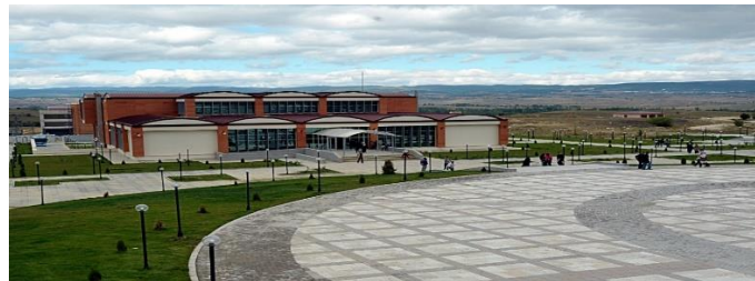
Resim 3- Kastamonu Üniversitesi Merkez Kafeterya Görünüm.