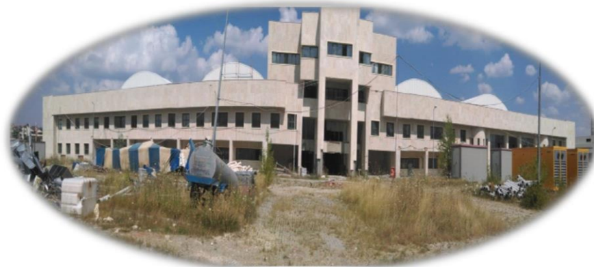
Resim 21- Hastane Ek Bina İnşaat Görünüm

Sağlık Bakanlığı ile yapılan yazışmalar neticesinde mevcut projelerin yönetmeliklere uygun olmadığı belirtilmiş olup, projelerin revize edilmesinin ardından Bütçe imkanları dahilinde gerekli çalışmalar başlatılacaktır.