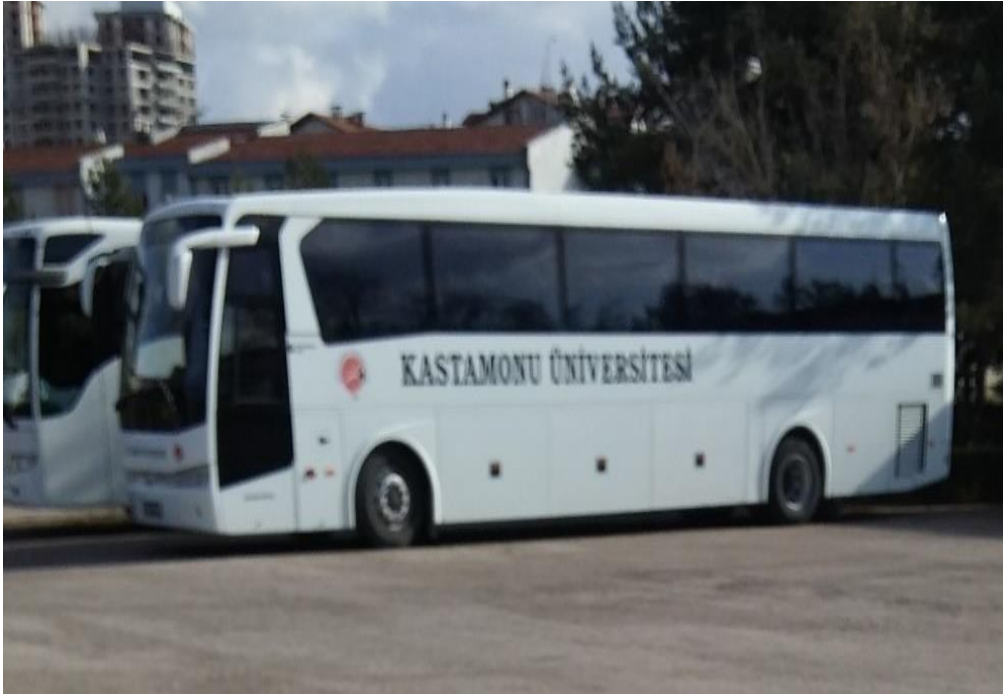
Resim 1- Taşıtlardan Görünüm

Aşağıda verilen tablodaki değerlerde taşıtır hesap cetvelinde kullanılan hesaplar baz alınmıştır. 2018 yılsonu itibarıyla, I. düzeyde 253 Tesis, Makine ve Cihazlar grubunda toplam 4.654, 254 Taşıtlar grubunda toplam 16 ve 255 Demirbaşlar grubunda da 130.532 adet taşıtır kayıtlıdır.