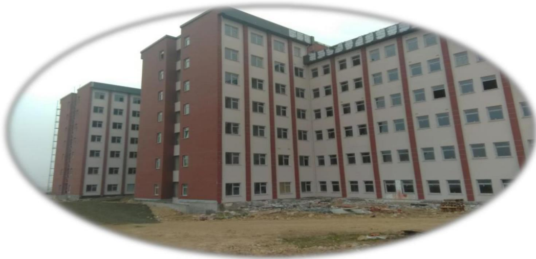
Resim 10- Kastamonu Tıp Fakültesi Morfoloji Binası Görünüm