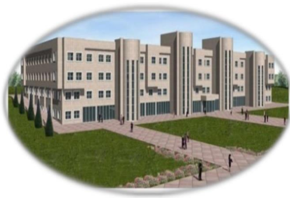
Resim 19- Hastane Binası Görünüm

Sağlık Bakanlığı ile yapılan yazışmalar neticesinde mevcut projelerin yönetmeliklere uygun olmadığı belirtilmiş olup, projelerin revize edilmesinin ardından Bütçe imkanları dahilinde gerekli çalışmalar başlatılacaktır.