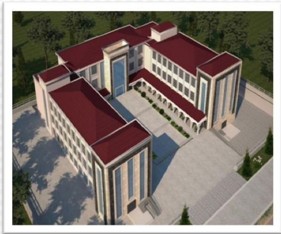
SPOR KOMPLEKSİ 3D GÖRÜNÜM