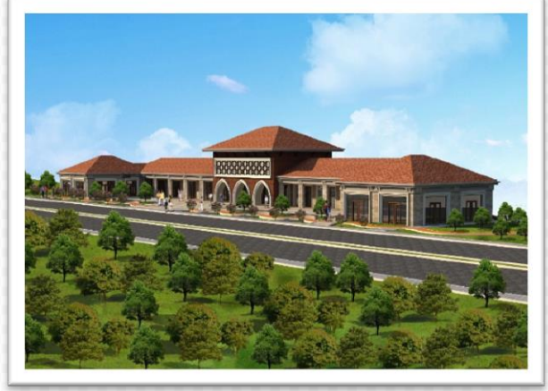
KUZEYKENT KÜLLİYESİ ÇARŞI ARKA GÖRÜNÜMÜ