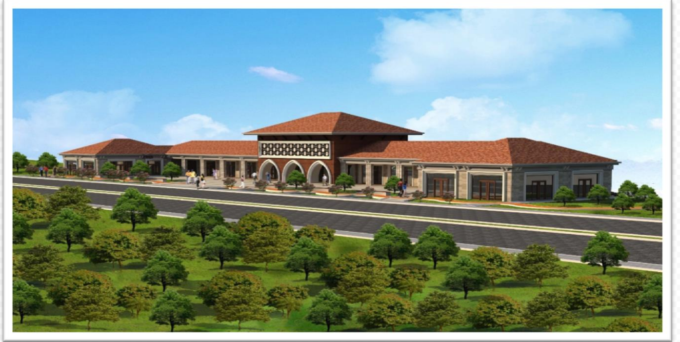
KUZEYKENT ÇARŞI 3D GÖRÜNTÜSÜ (ARKA CEPHE)