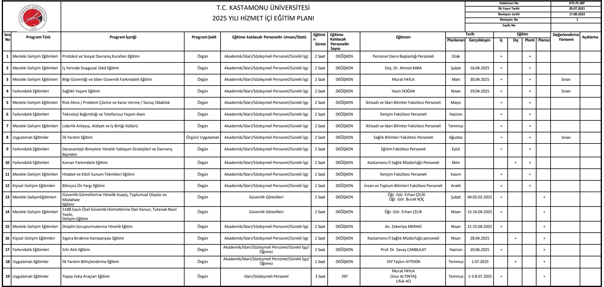
Tablo 25- Kastamonu Üniversitesi 2025 Yılı Hizmet İçi Eğitim Programı